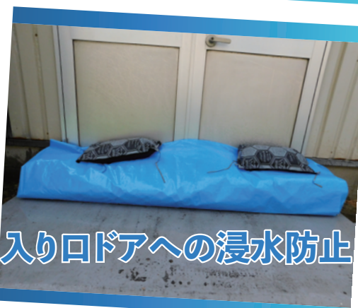
入り口ドアへの浸水防止

使用期限 :2028年 6月 直射日光を避け、未開封で保管した場合の 期限となります。